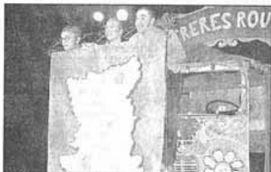
Les Frères Routards ont assuré, sur scène, la promotion des Deux-Sèvres

Sur scène, le décor occupe une position stratégique, à l'image de la cabine d'un fourgon Peugeot J9 relooké pour le voyage autour du monde effectué par les Frères Routards (Moscou, le Mexique, le Sahara... et même les Deux-Sèvres). Dévoilant la carte du département, ils en assurent