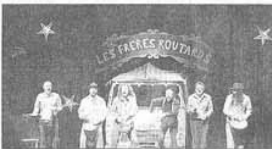
Les Frères routards ont transporté le public dans leur merveilleux périple dans un monde humain.

Un spectacle d'humour et de tendresse musicale à mi-chemin entre le cabaret et le concert où sont évoqués les problèmes de la vie quotidienne : l'administration où il faut revenir trois fois tout ça parce qu'il nous manque un document ; les voyageurs en attente d'un train qui a une